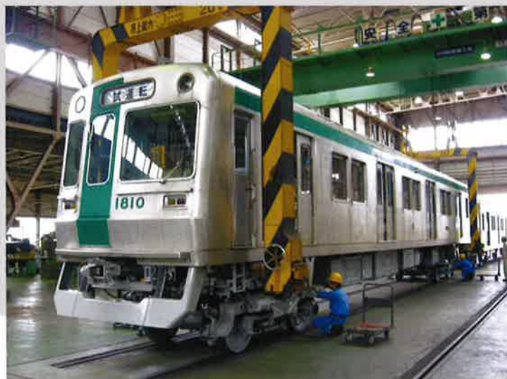
京都市交通局 竹田車両基地