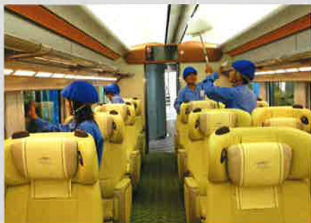
近鉄特急車内整備