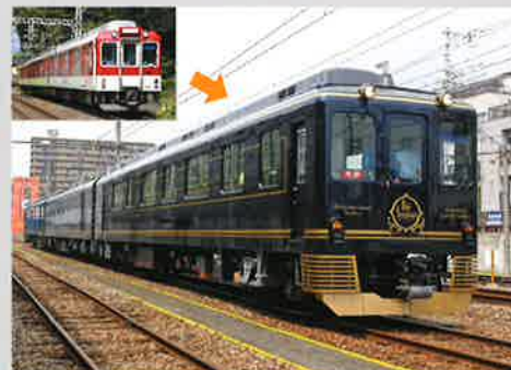
近鉄観光特急「青の交響曲」