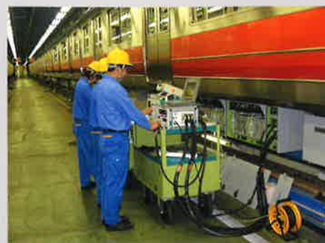
京都市交通局(機器テスト)