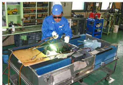
冷房装置オーバーホール

さらには、教習用シミュレーターの製作や、ショールーム・スタジオといった場所での車両の再現等、車体更新工事のノウハウを活かした様々な取り組みも実施しています。