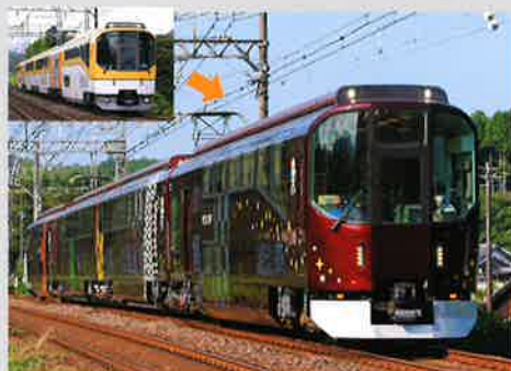
近鉄団体専用列車「楽」