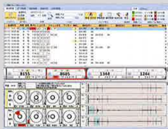
フラット検出装置