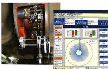
MMプロフィール測定装置