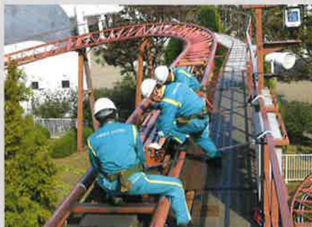
アトラクション施設保守点検