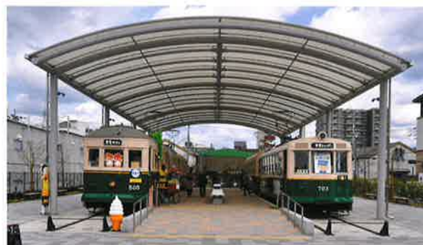
京都市電 車両展示(梅小路公園)