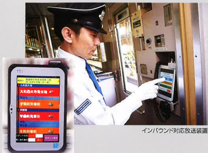
インバウンド対応放送装置