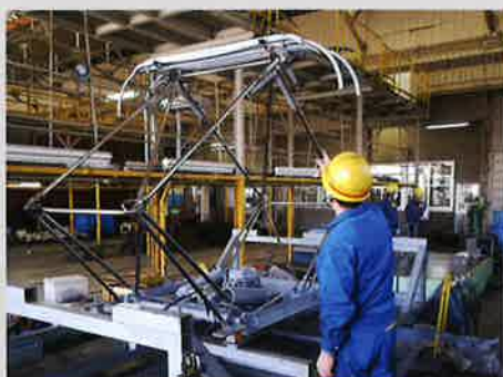
パンタグラフ点検