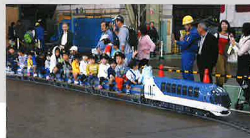
「しまかぜ」ミニ電車