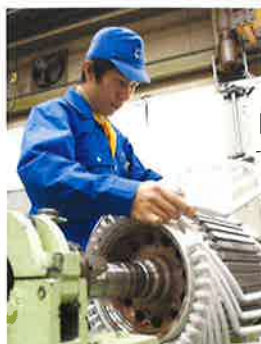
モーター絶縁更新