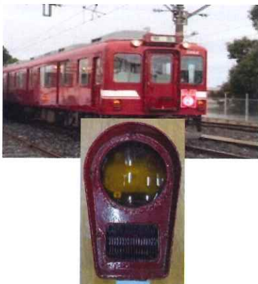
⑯ 標識灯 2680系用