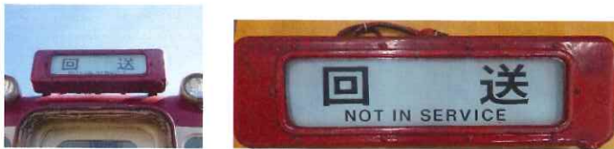
⑫ 行先表示器字幕正面(一般車用) A