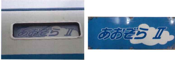
⑩ あおぞら側面パネル1枚