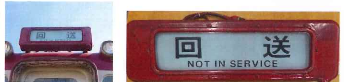
⑬ 行先表示器字幕正面(一般車用) B