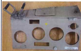
⑱ 運転台パネル 12200系用