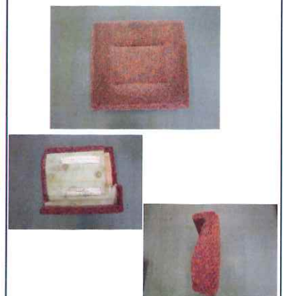
⑲ 座席座面 12200系用