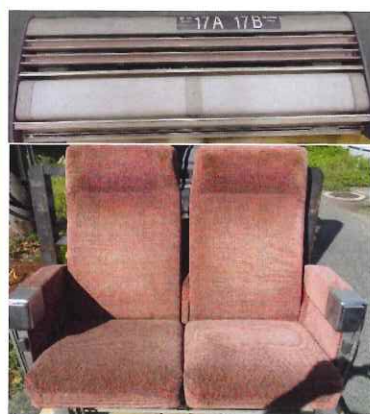
⑰ 座席+荷棚セット 12200系用