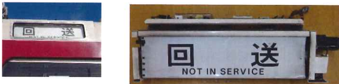
⑭ 行先表示器字幕側面(一般車用) A