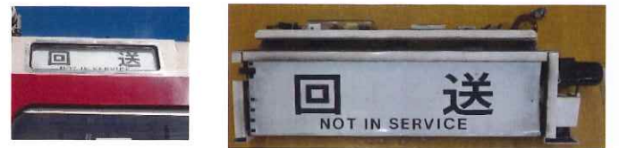
⑮ 行先表示器字幕側面(一般車用) B